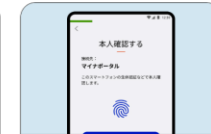
Androidスマホ用電子証明書搭載サービス

iPhoneに入れて利用できるマイナンバーカードです。iPhoneひとつで行政手続きや民間サービスへの申込ができます。