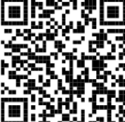
動画 (ダウンロード・80秒)