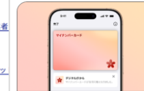
iPhoneのマイナンバーカード

「スマートフォンのマイナンバーカード」は、マイナンバーカードの機能をスマートフォン (iPhone、Android端末) に追加して利用できるサービスです。